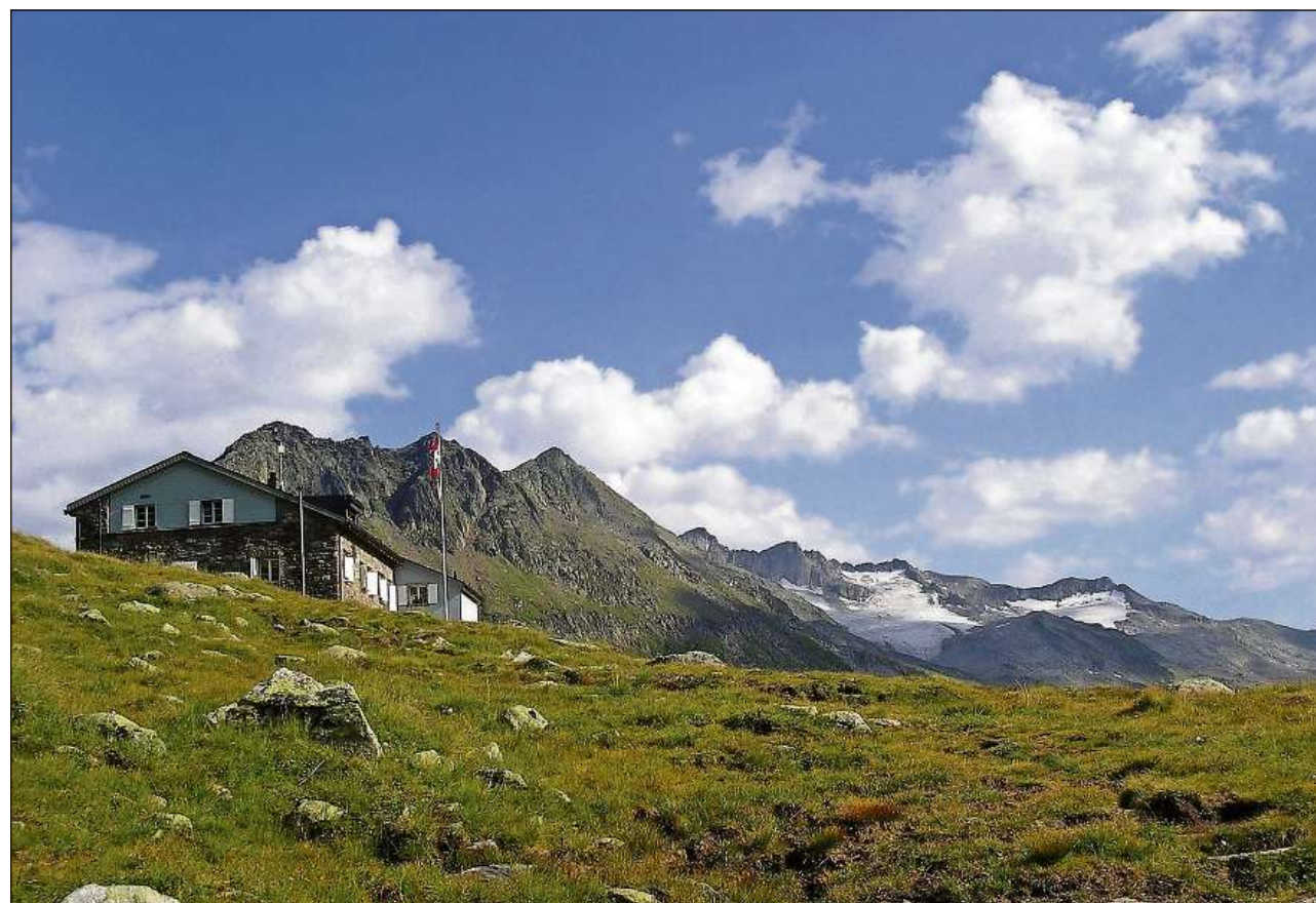
La chamona grischuna dal Club Alpin Svizzer cun las pli bleras pernottaziuns è anc adina Maighels en Surselva.