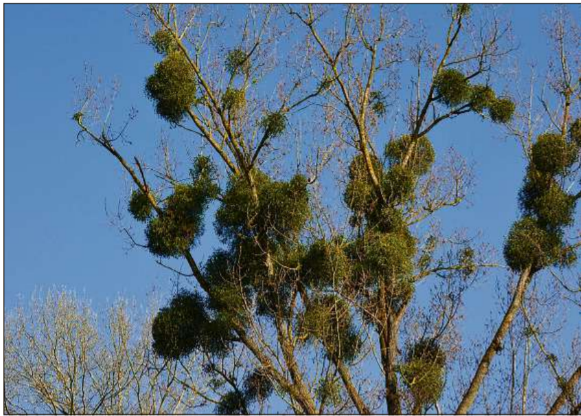
La vistga penda savens en furma da culla vi da la planta ospitanta.

Il svilup fitg plaun da la vistga ch'è era limità localmain è suttamess en il decurs da l'onn a ritmus severs. La fin da matg enfin la fin da zercladur creschan ils giuvens ro-