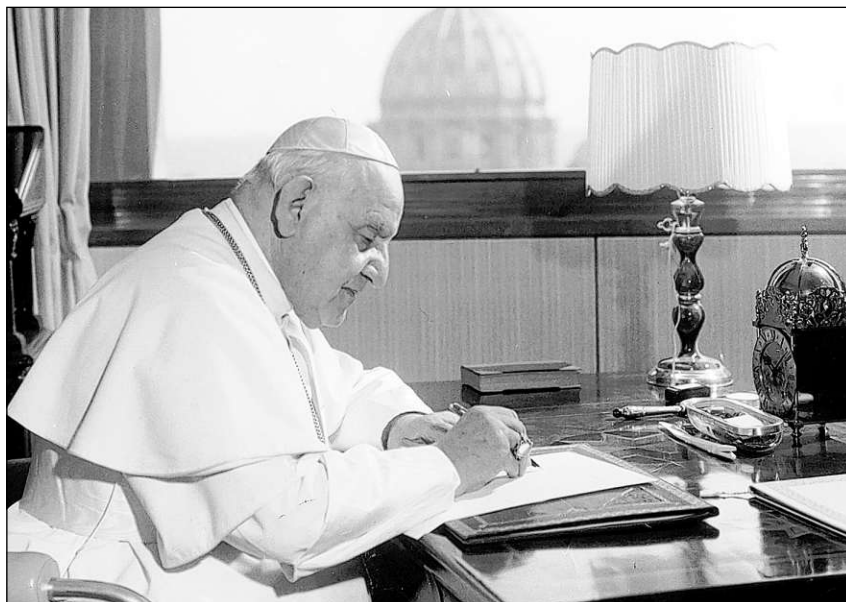
Gion XXIII (Angelo Giuseppe Roncalli, 1881–1963) e Gion Paul II (Karol Józef Wojtyła, 1920–2005) vegnan declarads sontgs.

Henri Tincq, autur da l'emprima contribuziun, ha gia scrit plis cudeschs e nondumbraivels artitgels a dumondas religiusas. El scriva: «La canonisaziun (...) da papa Gion Paul II (...) fa bun l'ingiustia d'ina memorgia curta che chala. La popularitad globala da papa Francestg fa donn al papa polac (...). Ins emblida l'imprim papa vegnì da l'ost che ha