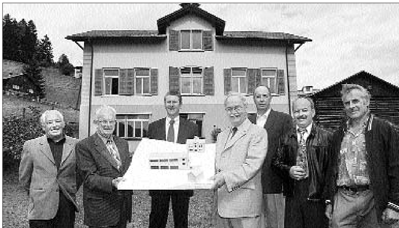
Cun agid dal Padrinadi svizzer per vischnancas en basegn pon era lieus pitschens realisar l'infrastructura necessaria sco scolars, sereneras eav. L'acziun «munaida per uffants» ha gidà a finanziar la sanaziun da la scola a Sarn.