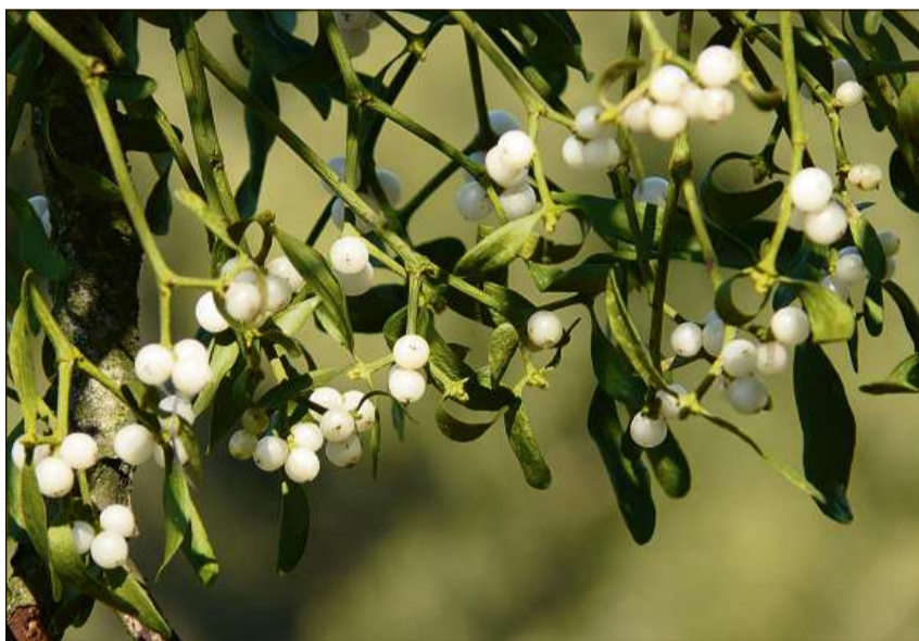
La feglia ed ils fritgs en detagl.